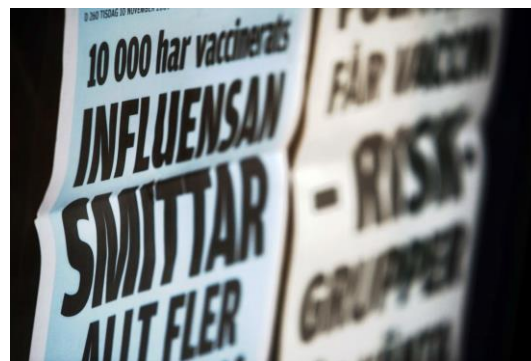
Bilden: Löpsedlar från år 2009

Detta antagande stärks av en snabb genomgång av gjorda studier av effekterna av tidigare pandemier. Effekterna på kort sikt har varit stora men redan på medellång sikt små. En studie av effekterna av Svininfluensan pekar på kraftigt ökade vårdkostnader och ett relativt stort produktionsbortfall under pandemin på grund av sjukfrånvaro. Den samhällsekonomiska konsekvensen av sjukfrånvaron bedöms dock inte ha varit större för Svininfluensan än under en vanlig säsongsinfluensa. 4 Människors beteenden förändrades inte heller märkbart efter pandemin.