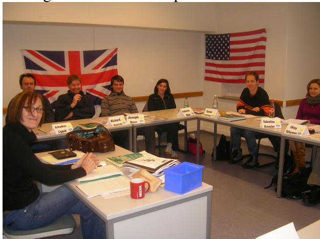
Deltagare i IdA-projektet, utbyte med Skottland