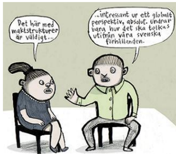
Illustration: Nina Hemmingsson