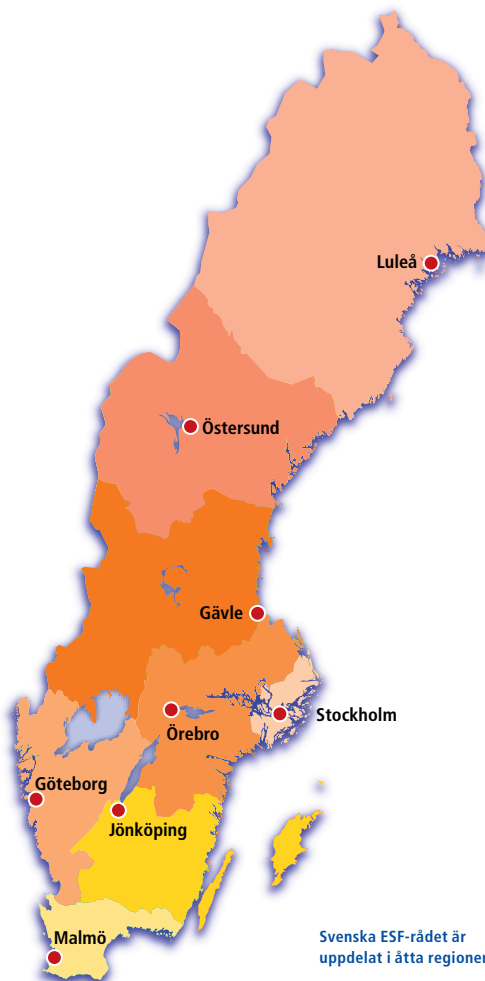
Svenska ESF-rådet är uppdelat i åtta regioner