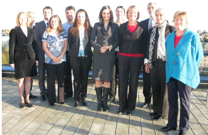
Den tjjeckiske amabssadören och vice utbildningsministern besöker projektet. De är intresserade av att delta i nästa fas av delprojektet Interkulturellt ledarskap