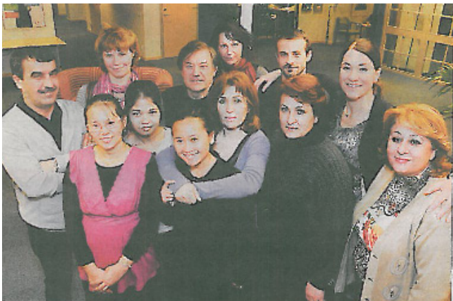
Deltagarna från delprojektet Interkulturella jobbcoacher