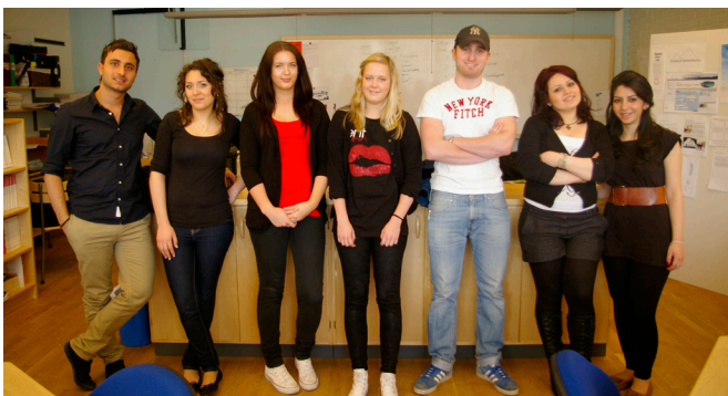
Några av ungdomarna från delprojektet Interkulturell kalender