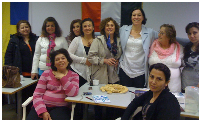
Ett av mötena inom delprojektet Äldreomsorgen