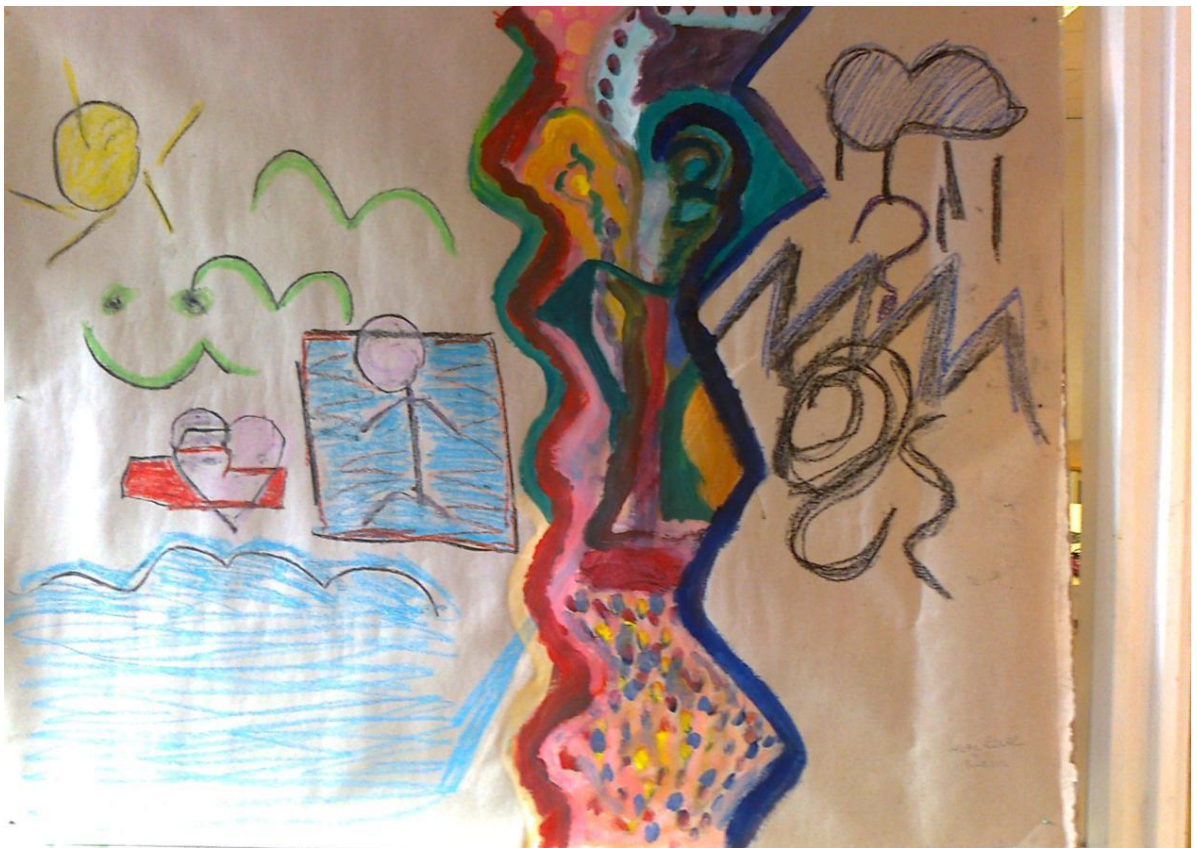
Bildillustration från workshop (följeutvärdering) tillsammans med MM Ung.

"Vi kommer överens om att hon ska börja i projektet, och hon säger att hennes vän Hilal och är intresserad. Den 4 april ska de komma båda två tillsammans med Halah och börja studera svenska mer ingående."