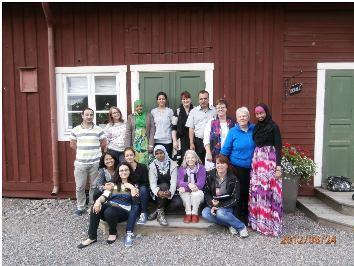
Utbildningsdag på Matjes Emils gård.

DOS-ambassadörsutbildningen syftade till att ge kursdeltagarna personliga kunskaper och erfarenheter om god relationsutveckling mellan invandrare och svenskfödda invånare i Borlänge. Utbildningen förväntades ge deltagarna pedagogiska verktyg som kan användas för att föra dialoger i livsfrågor som har med kultur, religiositet och kommunikation att göra. Det pedagogiska förhållningssättet var lösningsfokuserat, d.v.s. att man uppehöll sig vid att förstärka och mer tala om det som fungerar än det som inte fungerar. Utbildningen var till stor del upplevelsebaserad och byggde på deltagarnas aktiva deltagande.