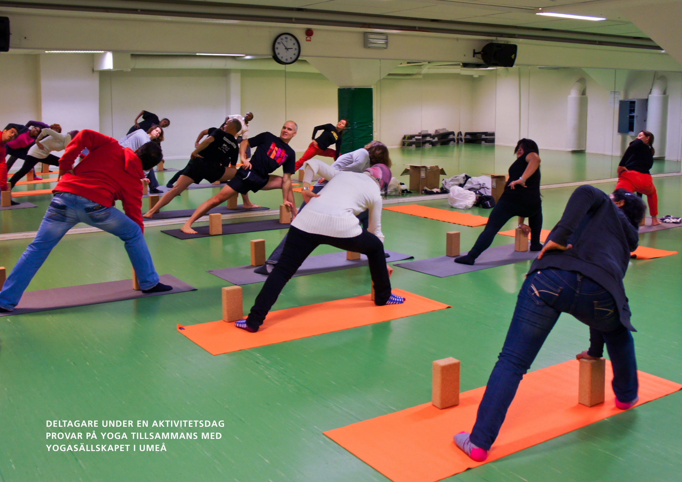
DELTAGARE UNDER EN AKTIVITETSDAG PROVAR PÅ YOGA TILLSAMMANS MED YOGASÄLLSKAPET I UMEÅ